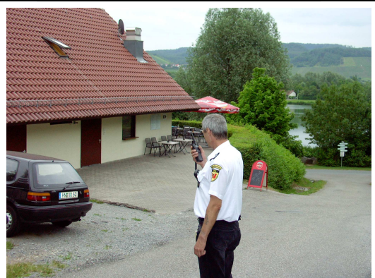
Umweltschutz - Kontrolle

Ihre Sicherheit sicher in unseren Händen